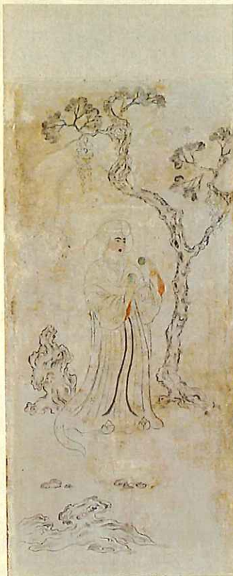
鳥毛立女屏風・第1扇(北倉)