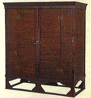
赤漆文欄木御厨子(北倉)