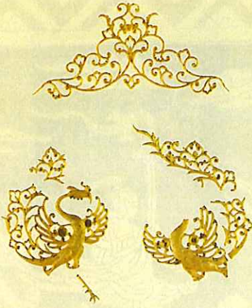
礼服御冠残欠(北倉)

本年の正倉院展は、天皇陛下の御即位を記念し、正倉院宝物の成り立ちを示す宝物や、宝庫を代表する宝物、シルクロードの遺風を感じさせる宝物が出陳されます。