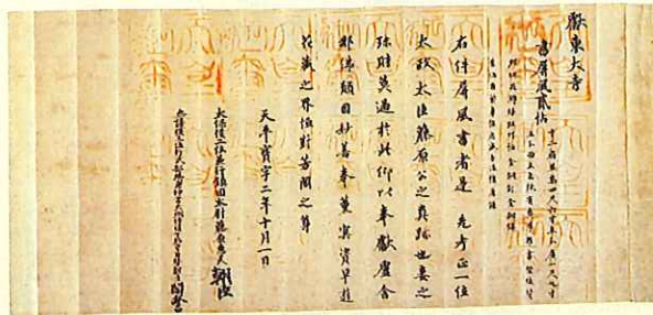
天平宝字二年十月一日献物帳 藤原公真跡屏風帳(北倉)