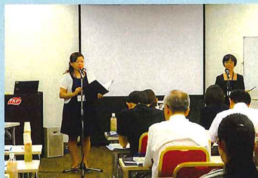
被爆体験記朗読会も行います

主催：国立広島原爆死没者追悼平和祈念館 広島平和記念資料館 広島市 後援：愛知県教育委員会 名古屋市教育委員会 広島市教育委員会 (公財)日本修学旅行協会 (公財)全国修学旅行研究会