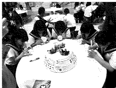
マイカップのデザイン中

技術系の見学場所なので女子はどうかと思 つたが、男女ともに興味深く見学できた。 「様々な展示品があつてとても楽しかった。 宇宙飛行士になりきり仕事をするゲーム等が あり、今の技術を面白く学ぶことができた。 技術がすごく進歩しているんだなと思つた。」 といった感想をもった。 (オービィー横浜)