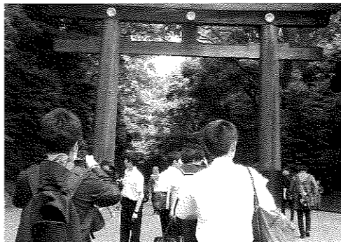
班別分散：明治神宮

8:30頃に舞浜駅を起 点に班の計画に沿って行 動し、15:30までに東京 デイズニールランド前に集 合した。交通系ICカー ドを利用する生徒が多 く、切符の買い間違えな どのトラブルもなく、終 えることができた。移動 する中で、どの生徒も東 京の人の多さを体感して いた。