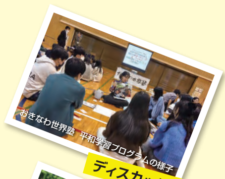
ディスカッション